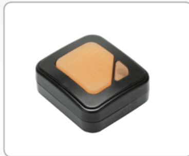
무선 PTT INT-2400

본 기기는 전파법 및 관련 규정에 의하여 신고 및 허가를 득한 뒤 사용하여야 합니다.